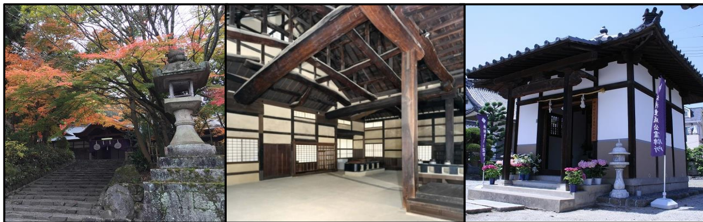
写真左から「枚岡神社」(東大阪市出雲井町)・「鴻池新田会所」(東大阪市鴻池元町)・「蓮城寺位牌堂」(東大阪市若江南町)