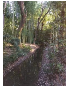
川中邸屋敷林(東大阪市今米)

中 甚兵衛頭彰碑、鴻池新田会所(国史跡)、川中邸屋敷林 中小阪地蔵尊、吉原地蔵尊などを紹介